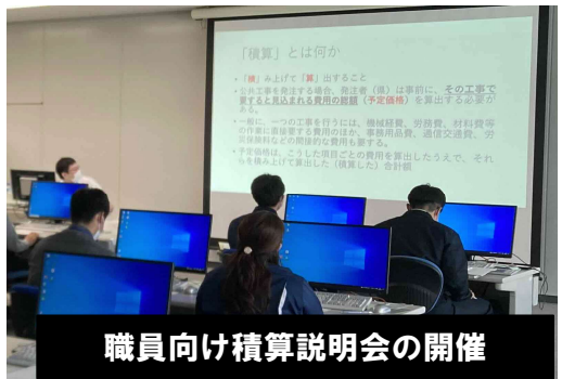
職員向け積算説明会の開催

★経歴 ※()内は担当業務 R5 農林水産部森林環境保全課 (1年) (工事積算システム、基準書等の管理) R2～ 平鹿地域振興局森づくり推進課 (3年) (林道事業、県営林事業) H29～ 山本地域振興局森づくり推進課 (3年) (林道事業、造林補助事業)