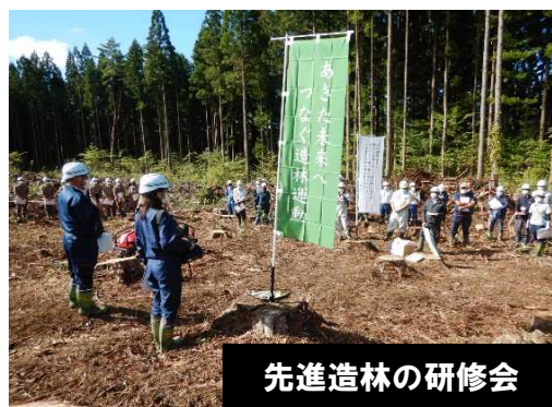
先進造林の研修会

R元～雄勝地域振興局森づくり推進課 (3年) (森林整備補助、 県営林事業、林道事業)