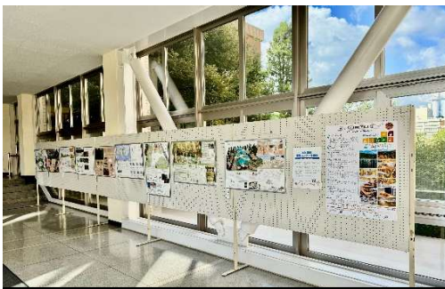
木材利用のPRポスター掲示