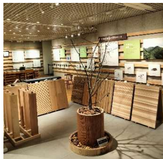
秋田材展示会の様子