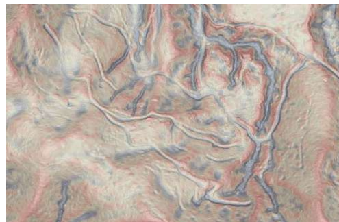
航空レーザ計測成果の例① 詳細な地形図