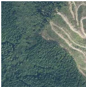
航空レーザ計測成果の例② 鮮明な航空写真