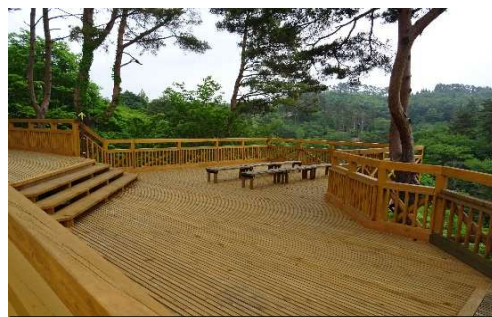
森づくり税事業で整備したウッドデッキ