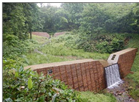
完成した治山ダム工