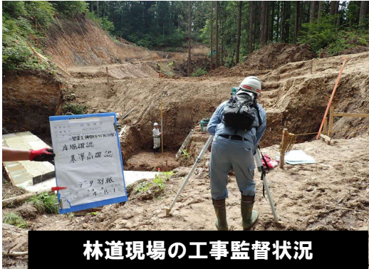
林道現場の工事監督状況

★帰宅後・休日の過ごし方 動画サブスクリプションでアニメ等の視聴 ★オススメの県産品 きりたんぼ ★秋田の良いところ お米がおいしい。