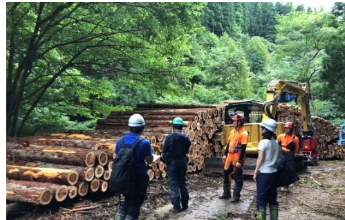
造林事業の現場の様子

お祭りが多いところ。夏の竿燈まつりには県庁竿燈会の囃子として参加しています。随時会員募集中です！