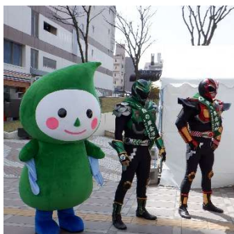
緑の募金街頭キャンペーン

08:20 登庁 (徒歩通勤20分) 08:30 始業・朝コミ・メールやToDoチェック 09:00 出張先に公用車で移動 10:00 学校緑化コンクールの現地調査 12:00 昼休み (昼食) 13:00 出張先から公用車で移動 14:00 帰庁後、調査結果の取りまとめ 17:00 メールや翌日のToDoチェック 17:15 退庁 (徒歩通勤20分)