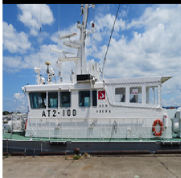
秋田県の漁業取締船 「くぼた」