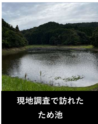
現地調査で訪れた ため池

8:15 登庁 (徒歩通勤15分) 8:30 始業、チームミーティング 8:45 メール確認、地域振興局からの問い合わせ対応 10:00 各種調査依頼、とりまとめ 12:00 昼休み 13:00 事業採択申請書関係資料の作成・申請 15:00 東北農政局へ問い合わせ 17:00 メール確認、明日の業務確認 17:15 退庁 (徒歩通勤15分)