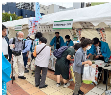
県内イベントの様子