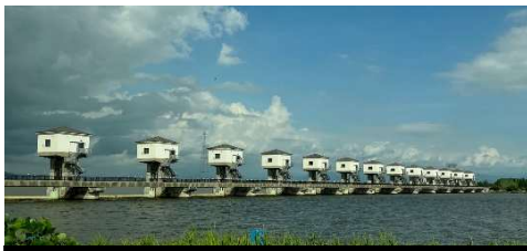
防潮水門 (男鹿市船越)