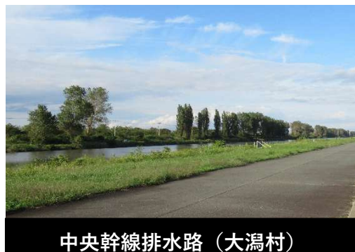
中央幹線排水路 (大瀧村)