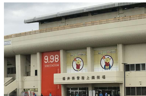
障害者スポーツ全国大会 (H30)