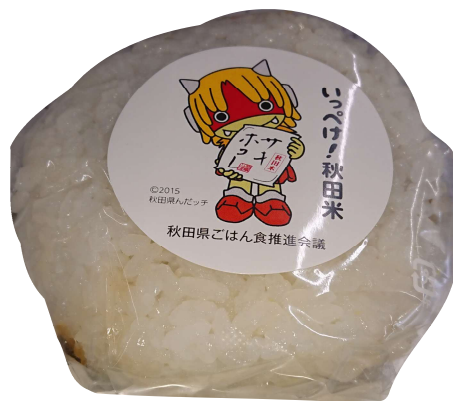
秋田駅前無料で配布したおにぎり