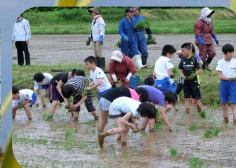
学校教育との連携