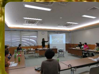
講師を招いたワークショップ