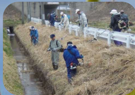
水路の草刈り活動

活動費用は国、県、市町村が負担しており、県では、活動計画や取組状況を調査した上で、必要な活動費用を国に予算要求し、市町村を経由して共同活動を行う各団体に交付しています。