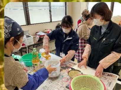
ハタハタ寿司作り体験