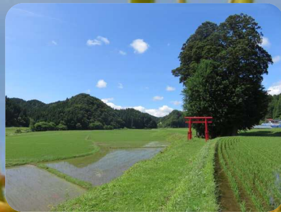
～守りたい秋田の里地里山50～ 「黒土地域」(五城目町)

各地域で取り組みたい活動の内容に応じ、活用できる事業について説明します。準備段階～活動の実践～終了後のフォローも含めて、関係者と打合せを行いながら地域の活動を支援します。