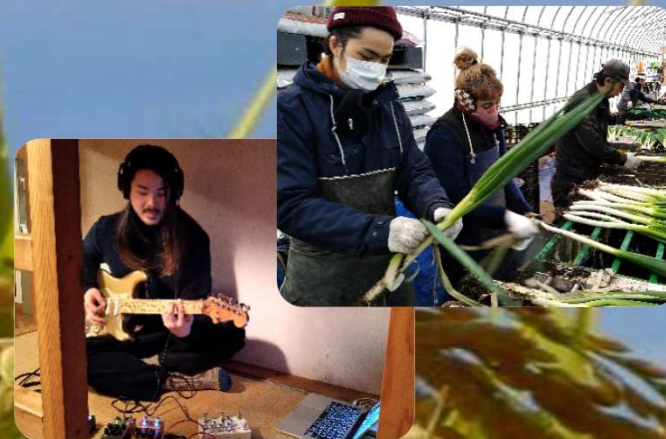
多様なライフスタイル「半農半X」