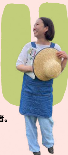
京内人U農姉妹勤務/姉デザイナー × classyスタッフ