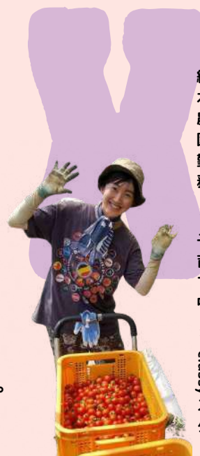
京内人U農姉妹勤務/姉子育て中 × classyスタッフ

上京して約10年働いていたIT関係の会社を辞め、子育て環境を優先するためUターンを決意。ミニトマトで就農。「稼げる農業」の実現に向け毎年新しいことにチャレンジし、雇用の創出にも力を入れている。