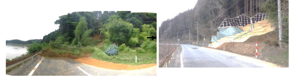
②災害関連緊急治山等事業による復旧