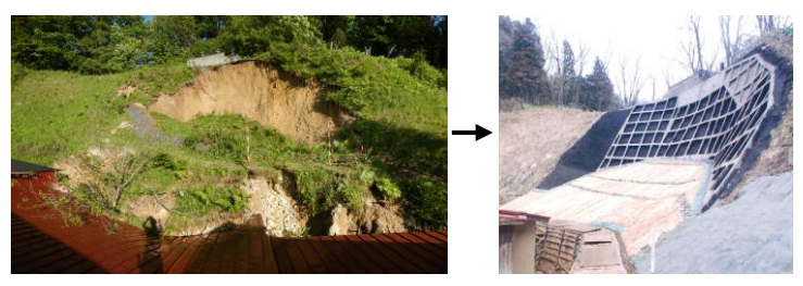
①林地荒廃防止施設災害復旧事業による復旧