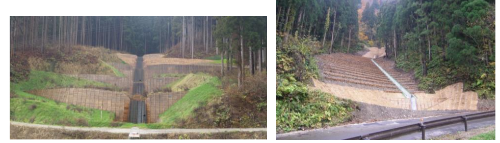
⑥公共治山事業（溪間工）の施工