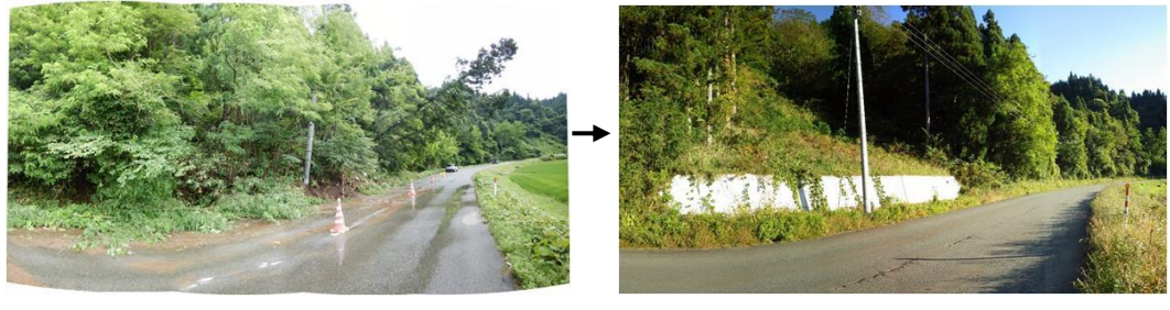
④県単一般治山事業による復旧