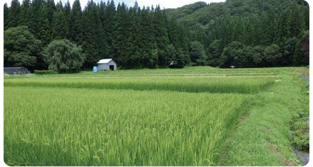
(所在地:仙北市田沢湖田沢) (規模:3.0ha)