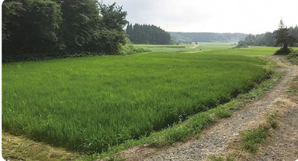
(所在地:能代市檜山) (規模:12.7ha)