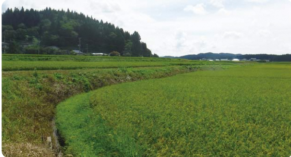
(所在地:山本郡三種町下岩川) (規模:13.6ha)