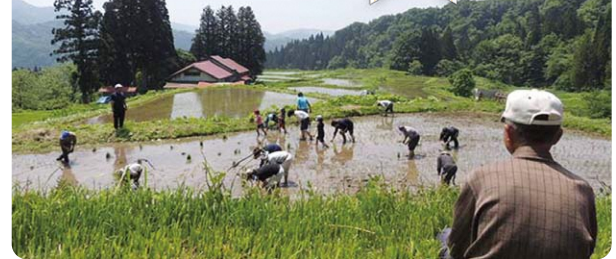
(所在地:山本郡藤里町藤琴) (規模:8.8ha)