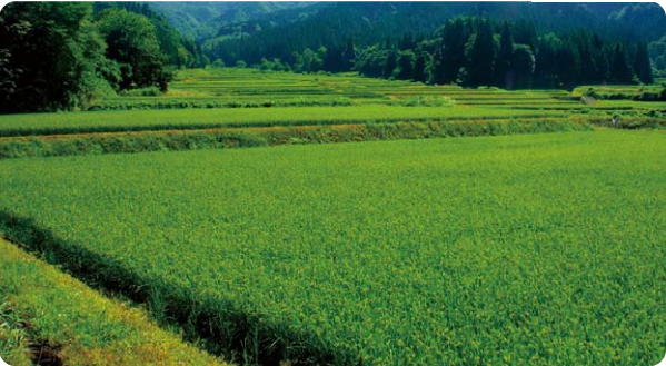
(所在地:仙北郡美郷町六郷東根) (規模:25.6ha)