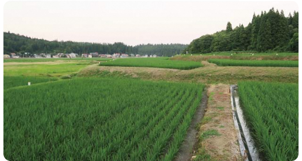
(所在地:横手市大森町八沢木) (規模:11.3ha)