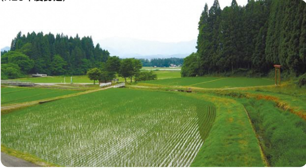
(所在地:仙北市角館町白岩) (規模:12.0ha)