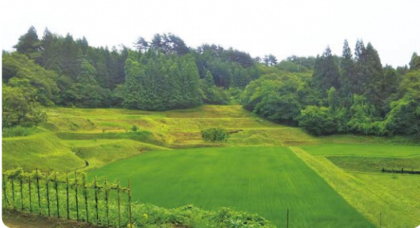
(所在地:潟上市飯田川) (規模:15.2ha)