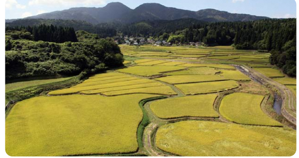
(所在地:男鹿市北浦安全寺) (規模:19.0ha)