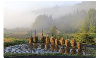
※最優秀賞作品（左：R3年度作品、右：R2年度作品）