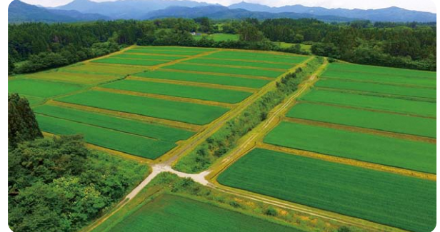
(所在地:山本郡八峰町峰浜水沢) (規模:7.1ha)