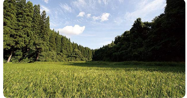
(所在地:潟上市昭和豊川) (規模:31.0ha)