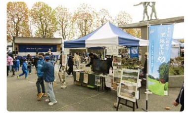
ブラウブリッツ秋田ホーム会場でのプロモーション活動