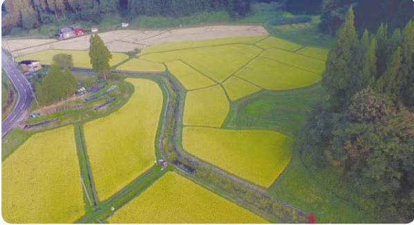
(所在地:秋田市雄和萱ヶ沢) (規模:48.0ha)